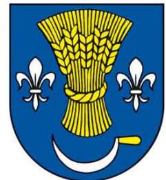
Obrázok 2 Erb obce

Erb obce Pušovce tvorí v modrom štíte nad strieborným kosákom so zlatou rukoväťou zlatý obilný snop, sprevádzaný po bokoch striebornými heraldickými ľaliami Panny Márie. Erb obce je zapísaný v Heraldickom registri SR pod signatúrou P-32/1994.